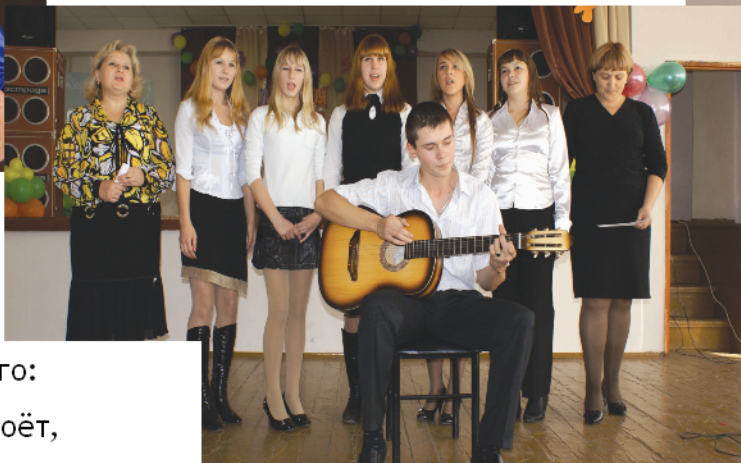
Выступление 9 Д класса с песней «Осень» под гитару

У нас талантов очень много: Кто-то танцует, а кто-то поёт, Играет на гитаре, стихи сочиняет И школе этим помогает.